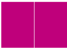
Doppelseite EUR 650,00*